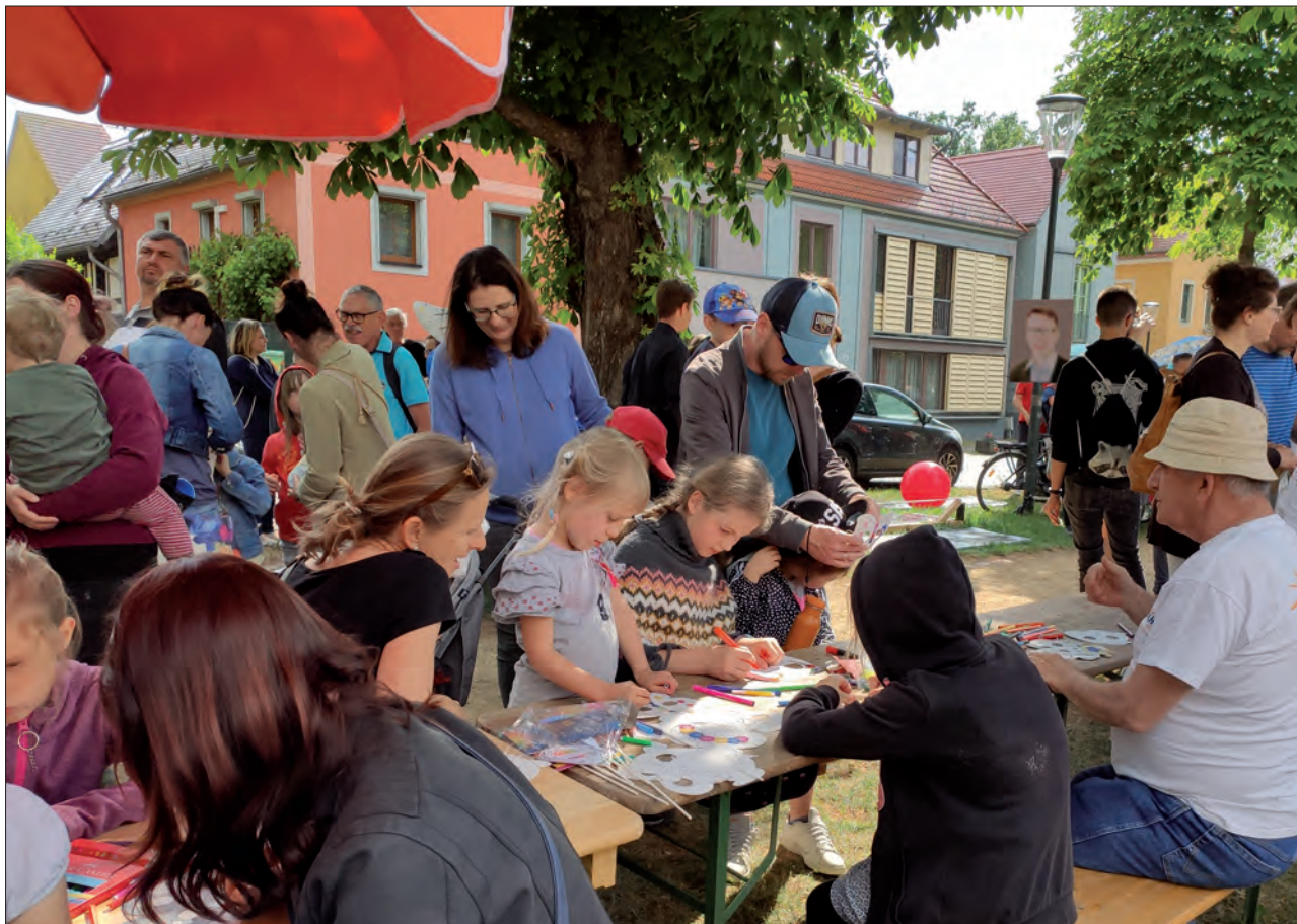
Kindertag in Altkötzschenbroda 2023